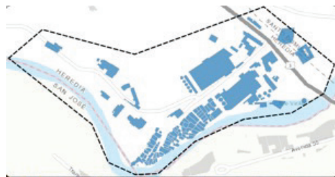
Figura 1. Ejemplo de mapa base de trabajo